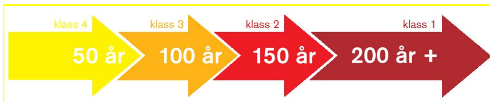
Figur 4. Schematisk beskrivning av hur miljöns kontinuitet över tid och naturvärde kan hänga ihop.

För samtliga naturtyper gäller att ju högre naturvärde desto känsligare är de. Ett av de största hoten för biologisk mångfald förutom exploatering av värdefulla miljöer, är fragmentering (d v s uppsplittring) av naturmiljöer av en viss naturtyp, samt påverkan på spridningssamband genom anläggande av vägar eller bebyggelse. Denna aspekt har inte ingått i detta uppdrag och behandlas därför inte i detalj.