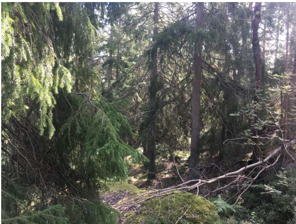
Figur 2. Äldre talldominerad barrblandskog med inslag av gran upptar en relativt stor yta av undersökningsområdet.

Stora delar utgörs av mer högvuxen barrblandskog, till större delen talldominerad. Inslaget av gammal tall är bitvis stort men stora delar utgörs av avverkningsmogen skog med en beståndsålder på cirka 100 år. Fältskiktet utgörs huvudsakligen av blåbärsris men inslag av lågörtspartier förekommer också.