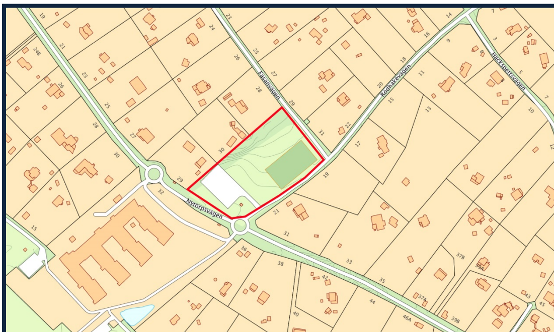
Karta med ungefärligt planområde markerat i rött.

Del av Trinntorp 1:1, Östra Tyresö, Tyresö kommun, Stockholms län