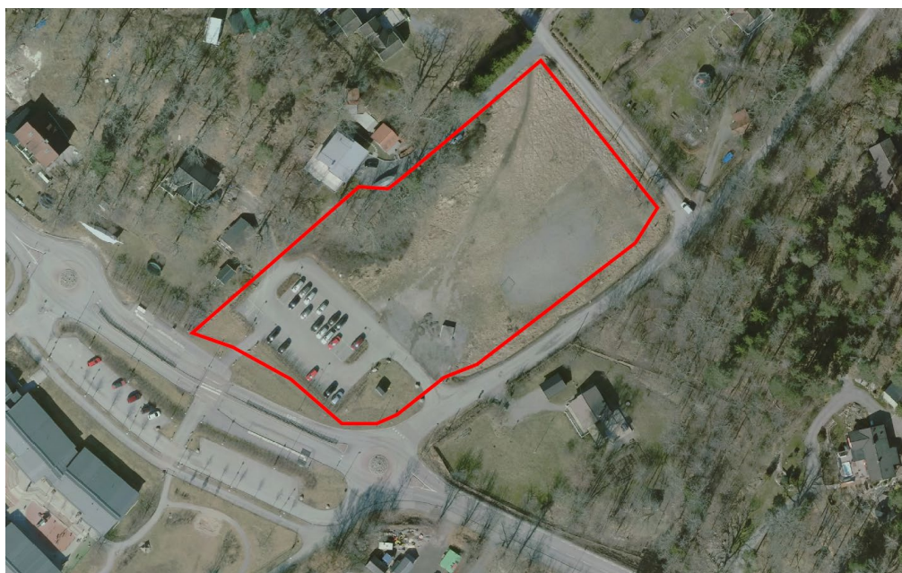
Flygfoto över planområdet markerat med röd linje.

Planen har ingen påverkan på betydande eller känsliga kulturvärden, och påverkar inte heller några skyddade eller utpekade kulturvärden.