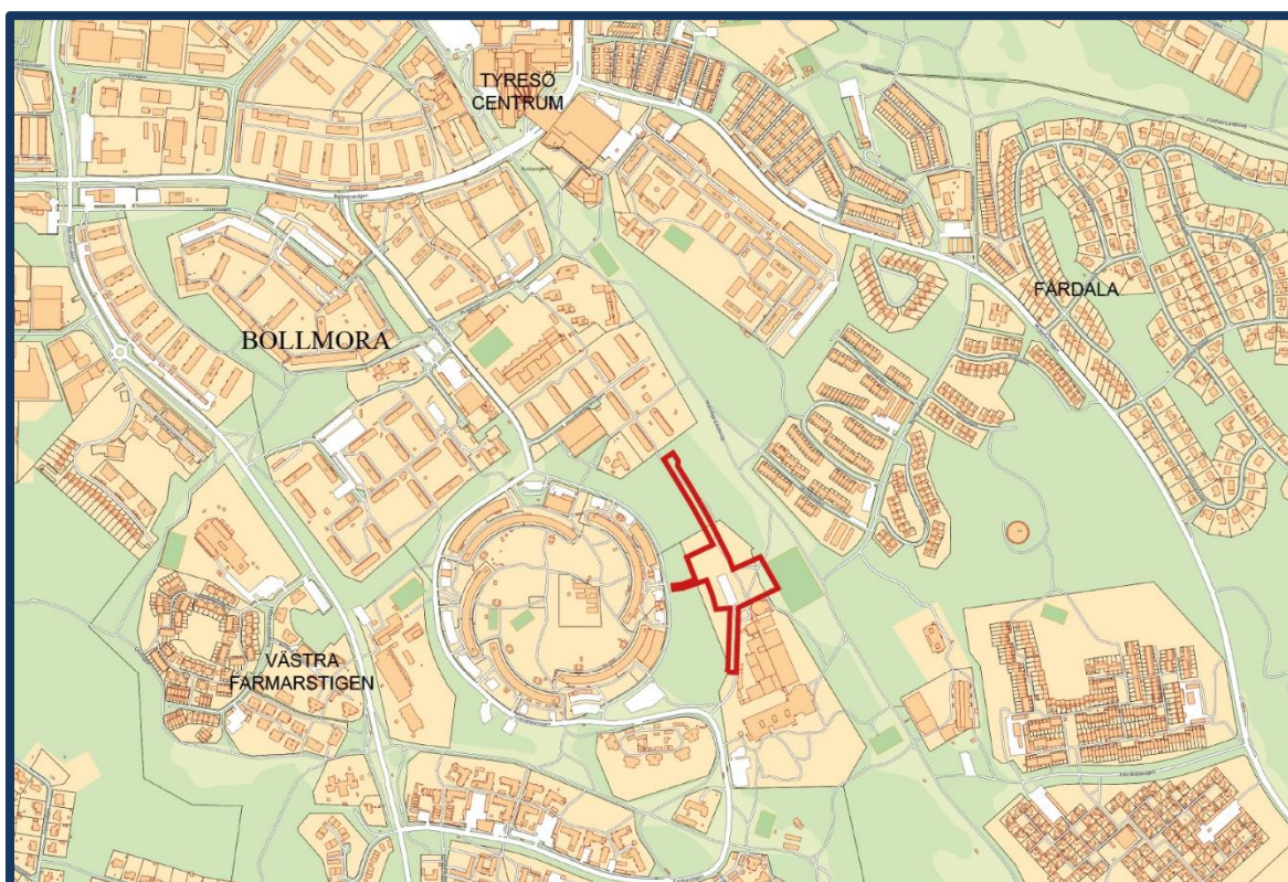
Karta som visar planområdet markerat i rött.

Del av fastigheterna Bollmora 2:1, Näsby 4:1367 och Näsby 4:1469 Inom Tyresö kommun, Stockholms län