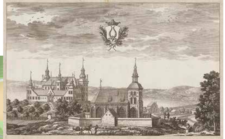
TYRESÖ SLOTT OCH KYRKA I ETT KOPPARSTICK FRÅN 1600-TALET AV ERIC DAHLBERG.