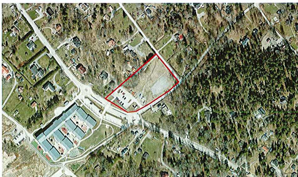
Ortofoto över del av Trinntorp 1:1 (rödmarkerad)

Syftet med planen är att möjliggöra en förskola till följd av en förutspådd ökning av efterfrågan på förskoleplatser i kommunen. Syftet är även att möjliggöra etablering till följd av ett förutspått behov med utbyggnaden av kommunalt vatten och avlopp i Östra Tyresö. Ytterligare är syftet även att möjliggöra samlingslokal i området utifrån översiktsplanens intentioner där denna plats beskrivs som lämplig.