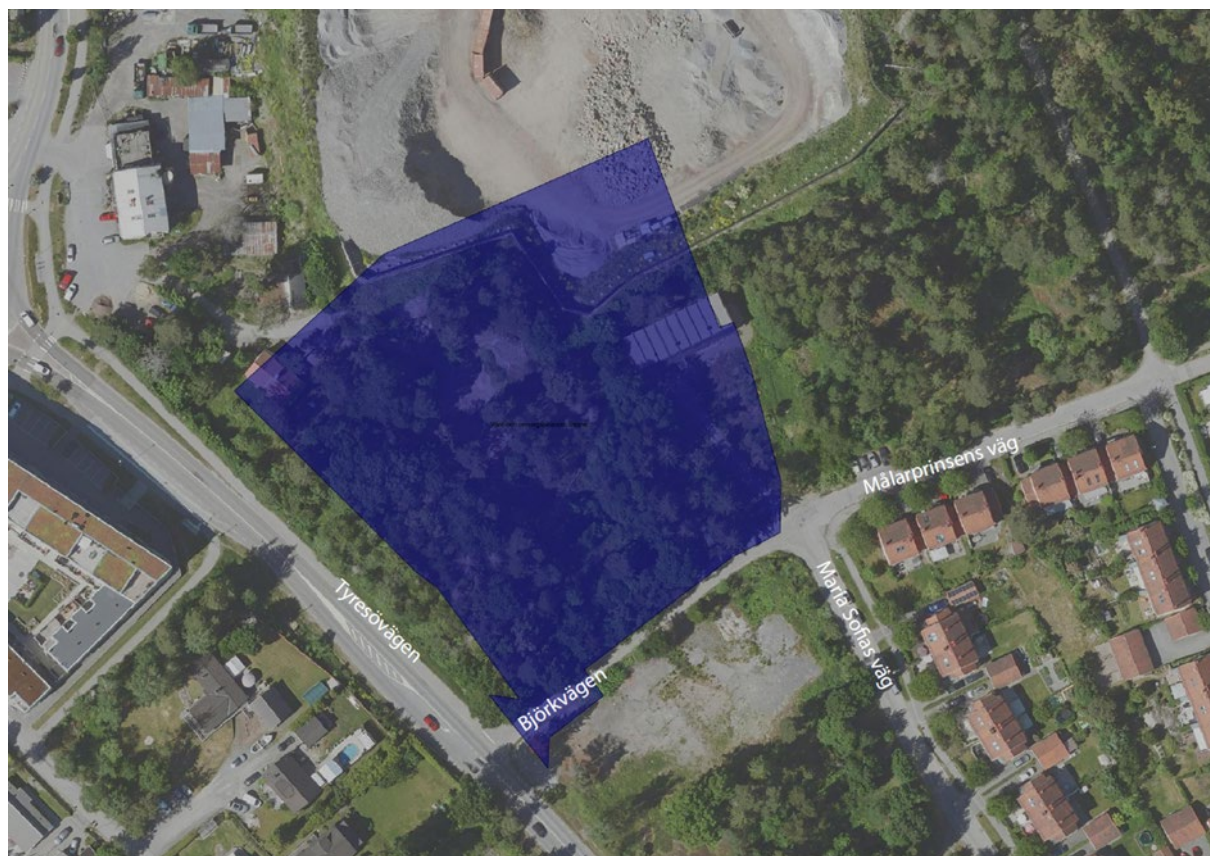
Figur 1: Ortofoto över ungefärligt planområde med omnejd. Planområdet är markerat i blått. Planområdet ligger vid Tyresövägen och Björkvägen.