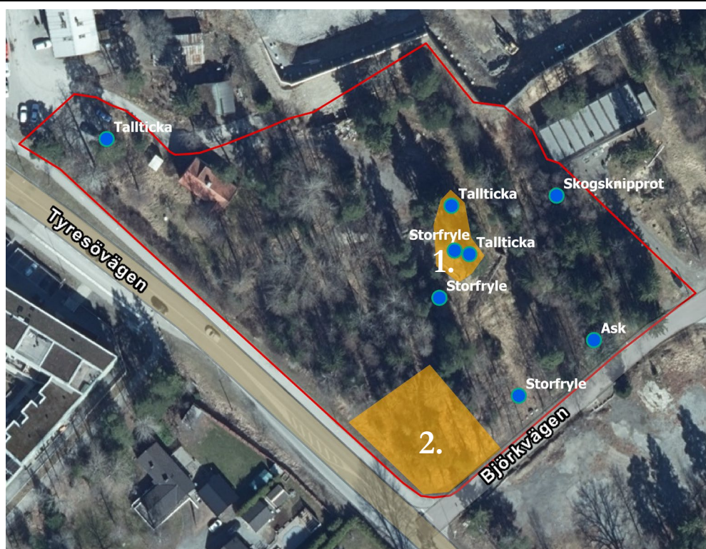
Figur 1: Karta över resultatet från fältinventeringen som illustrerar de två naturvärdesobjekt som avgränsades samt de naturvärdsarter som identifierades inom inventeringsområdet. Naturvärdesinventering, Strand, Tyresö kommun, Sweco, 2023-09-22.

Biotopvärdena utgörs framför allt av grova och gamla träd samt hålträd. De högsta naturvärdena återfinns i den del av inventeringsområdet som utgörs av blandskog med inslag av våtmark (naturvärdesobjekt 2). Biotopvärden inom inventeringsområdet är främst knutna till förekomst av bärande och blommande träd och buskar vilket gynnar insekts- och fågellivet. Inom inventeringsområdet noterades fyra naturvärdsarter kopplade till gamla träd och fuktiga skogsmiljöer samt sju särskilt skyddsvärda träd och två fridlysta arter av kärvläxter. I anslutning till inventeringsområdet finns sex fynd av de invasiva arterna kanadensiskt gullris och parkslide. De delar av inventeringsområdet som inte ingår i något naturvärdesobjekt har inte bedömts uppnå lägsta naturvärdesklass för denna inventering, klass 4, visst naturvärde.