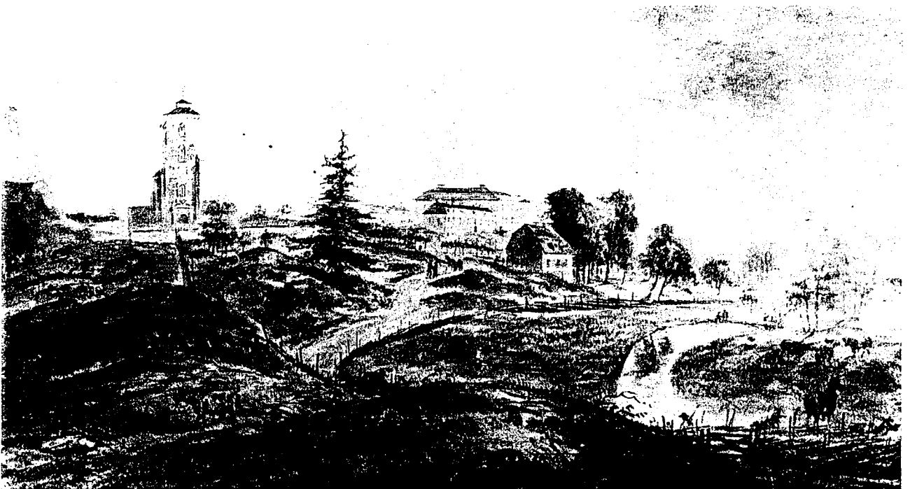
Hur Tyresö slott tedde sig efter Scheffers ombyggnad framgår av denna akvarell av Elias Martin från slutet av 1700-talet. Nationalmuseum.

Vår utgångspunkt är att det kulturlandskap som är värt att bevara inte nödvändigtvis måste beskriva det exakta utseendet vid en given tidpunkt. Det är snarare viktigare att lyfta fram ett landskap som ger besökaren en något så när riktig föreställning om hur området tedde sig när Tyresö slott var den ekonomiska drivkraften och försörjningskällan för människorna i området. Besökaren ska kunna känna historiens vingslag. Till hjälp för vår beskrivning av kulturlandskapet under slottets glansdagar finns i Tyresö kommuns kulturminnesvårdsprogram målningar och kopparstick från 1600- och 1700-talen.