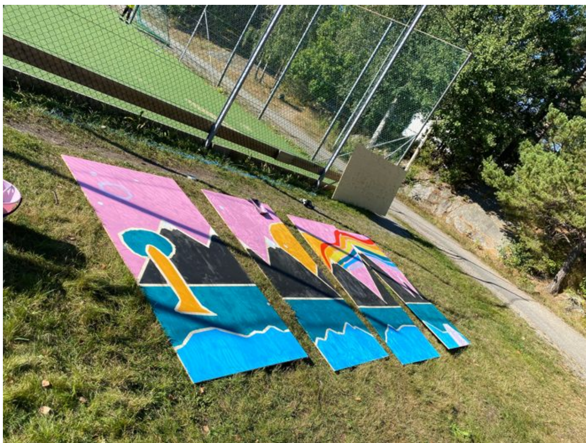
På bild visas en muralmålning som växer fram på Bergfotens skola.