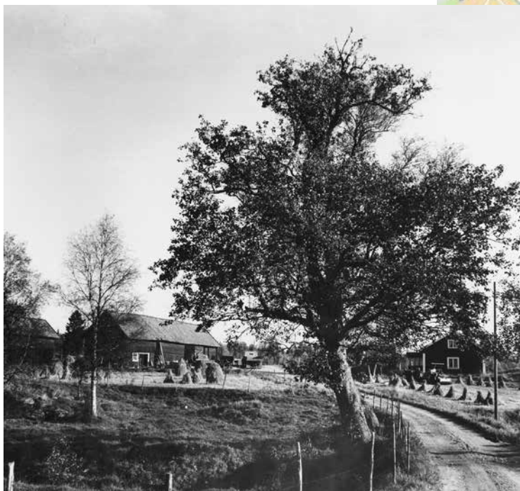
VÅGEN MOT MYGGDALENS GÅRD, NUVARANDE BOLLMORAVÄGEN, FRÅN OK-MACKEN MOT CENTRUM.