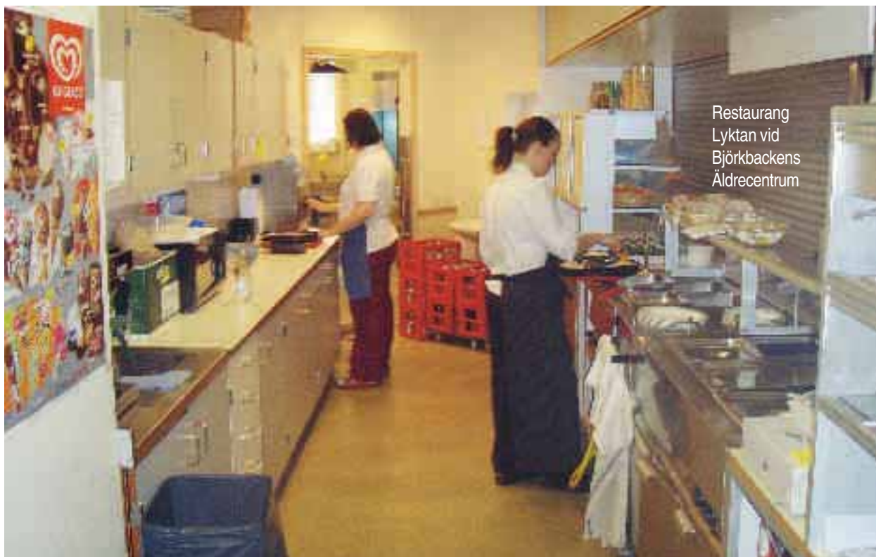
Restaurang Lyktan vid Björkbackens Äldrecentrum

Det är återkommande möten mellan arbetsgivare, arbetsförmedlingen, den sjukskrivne,