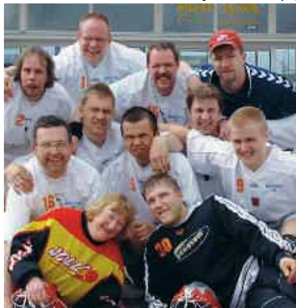
Ett av Bergfotens innebandylag

Du kan också ringa för mer information på telefon 08-620 17 00.