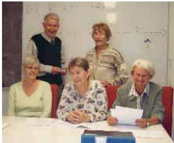
Möte i Afasiföreningen

RSMH, Riksföreningen för Social och Mental Hälsa. Telefon: 08-798 81 14.