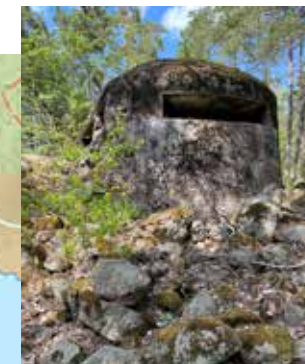
BUNKER PÅ MÅNDALSBERGET