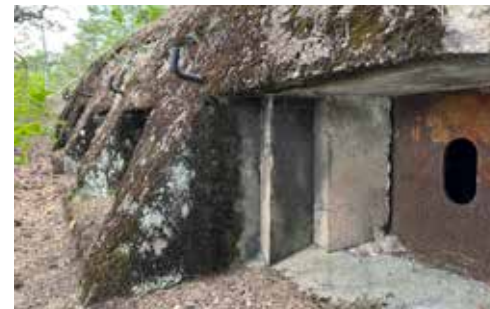
LUCKA FÖR STRÅLKASTARE, LÅNGSJÖFÖRTET. NR 7 PÅ KARTAN

Solsäter byggdes 1922 som sommarhem av och åt medlemmarna i Kulturella folkdansgillet. Den stora gillestugan med målad dekor var plats för dans och umgänge, verksamhet som föreningen fortfarande driver. Varje år arrangeras två dagars traditionellt midsommarfirande på platsen nedanför. Timmerbyggnaden i nationalromantisk allmogestil hade från början torvtak. Solsäter blev år 2012 statligt byggnadsminne och är ett av landets bäst bevarade föreningshus av denna typ. Nummer 5 på kartan.