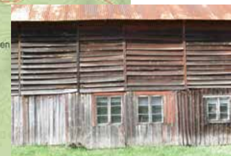
TOR KLADA VID GUDÖ Å MED STÄLLBARA BRÄDOR