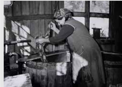
TVÄTTEN SKÖLJDES I STORA KAR. 1962.

4. På Måndalsberget började huvudfortet i "Kumlapasset" byggas 1903. Här skulle 120 soldater med hjälp av fyra kulspjut och gevär bemanna ett stort system av bunkrar och täckta värn. De hade långa siktlinjer över hela området med landsvägen från söder och bron över Gudö å. Vid sjön finns ett öppet skyttevärn, medan de på berget var täckta konstruktioner med egna ingångar.