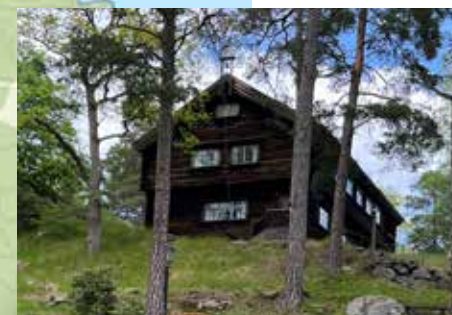
KULTURELLA FOLKDANSGILLET'S FÖRENINGSHUS: SOLSÄTER